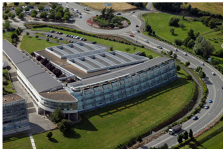
Lycée Jean Moulin